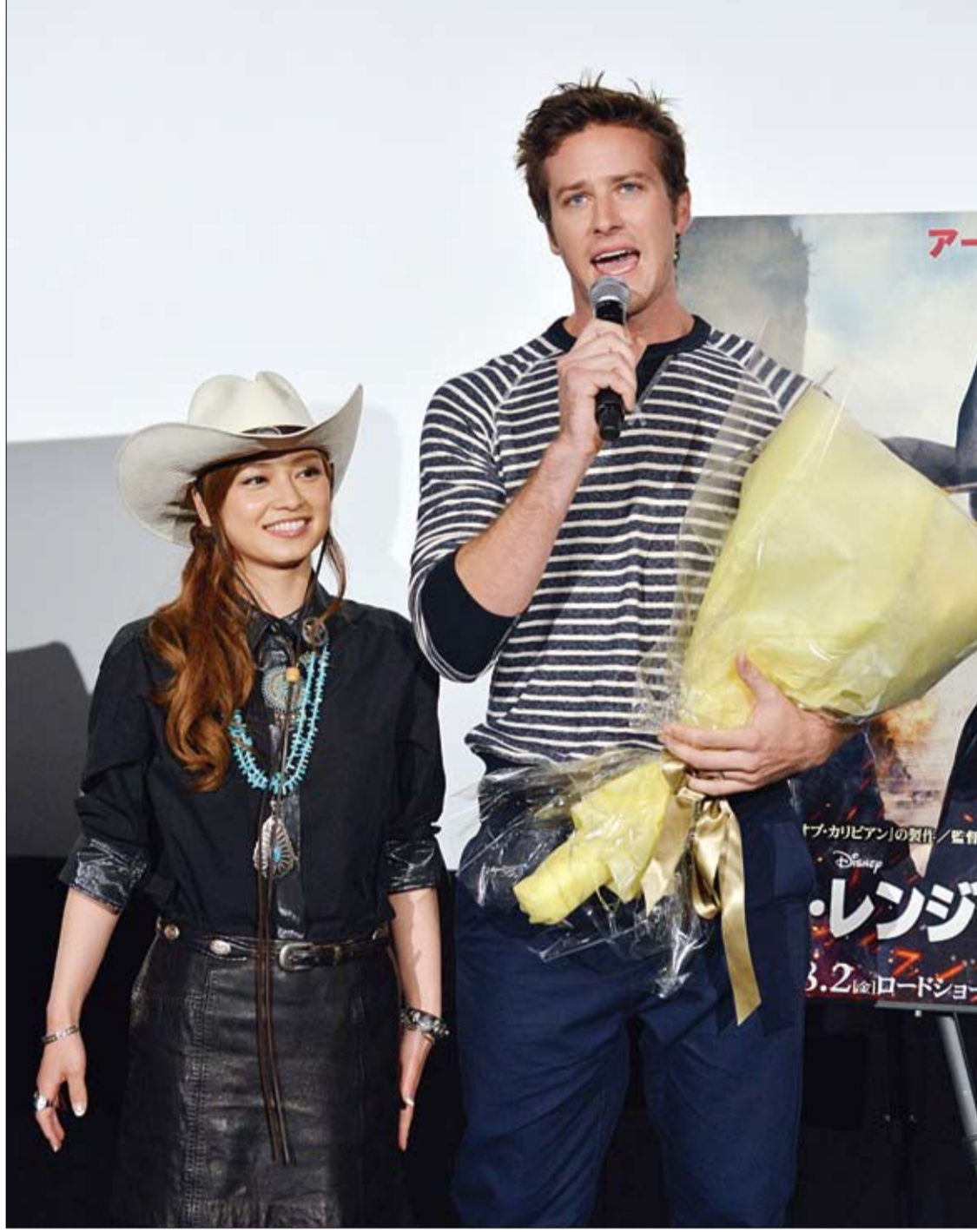
الممثل الأمريكي أرمي هامر يلقي كلمة عقب تلقيه باقة ورد من الممثلة اليابانية إيرى تايرا وتحدث في كلمته عن فيلمه الجديد الحارس الوحيد الذي يعرض في طوكيو.